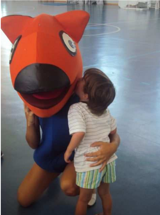
Fotografia del personatge conductor en Jeroni Stilton a l'Escoleta d'Estiu 2012

La primera actuació emmarcada dins el projecte "La conciliació de la vida familiar i laboral, Montuïri 2012-2014" aprovat el recent Plenari del 7 de juny, fou "l'Escoleta d'Estiu Montuïri 2012", que s'inicià el dia 25 de juny amb un elevat nombre d'inscripcions que enguany superà els 85 infants i acabà el passat 9 de setembre.