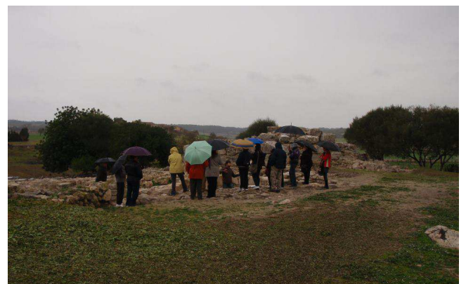
La visita del grup de S'Hostal escolta, de forma estoica sota la pluja, les explicacions al jaciment.

A banda dels amics de s'Hostal també ens han visitat l'Associació d'Amics de l'Arxiduc de Palma i l'Obra Cultural Balear, de Porreres.